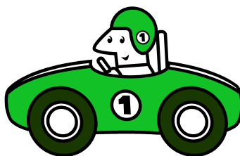
Рис. 1 Образец брэнда фирмы «Рога и копыта» по скоростной доставке пиццы

Если рисунок располагается на нескольких листах, то на каждом последующем листе указывается номер рисунка, за которым следует слово «Продолжение». Например: Рис. 2.1. Продолжение